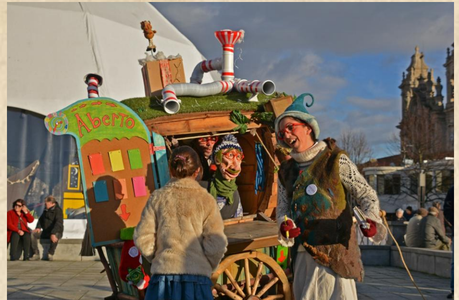
FÁBRICA DAS BRINCADEIRAS - Natal