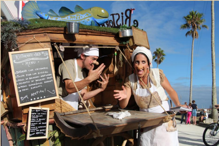
RISTORANTE – Eventos Gastronómicos